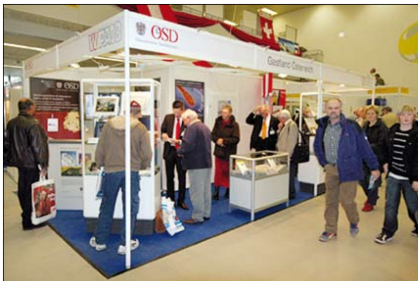
Der Messestand in Sindelfingen.